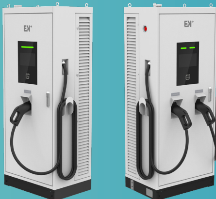
DC050K 吊り下げアーム取付例